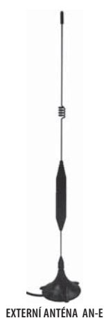
EXTERNÍ ANTÉNA AN-E