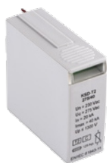
KSD-T2 275/40 M