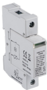
KSD-T2 275/40 1P