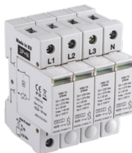
KSD-T2 275/160 3P+N