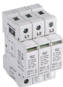
KSD-T2 275/120 3P