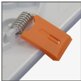
sprężyny umożliwiające montaż podtynkowy