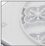
radiator z tyłu obudowy