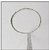
średnice otworów montażowych:

DLW-R075/S075: ø55 DLW-R125/S125: ø105 DLW-R185/S185: ø165 DLW-R215/S215: ø195